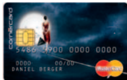
Détail de «The dying stars»