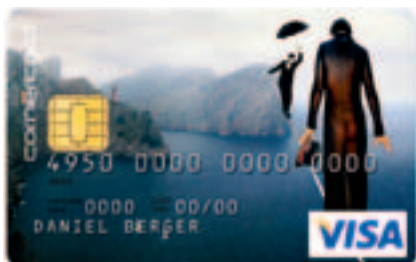
Détail de «The space between the heavens»

«MA DEVISE: L'ART DONNE DES AILES À L'IMAGINATION.»