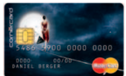
Ausschnitt aus «The dying stars»